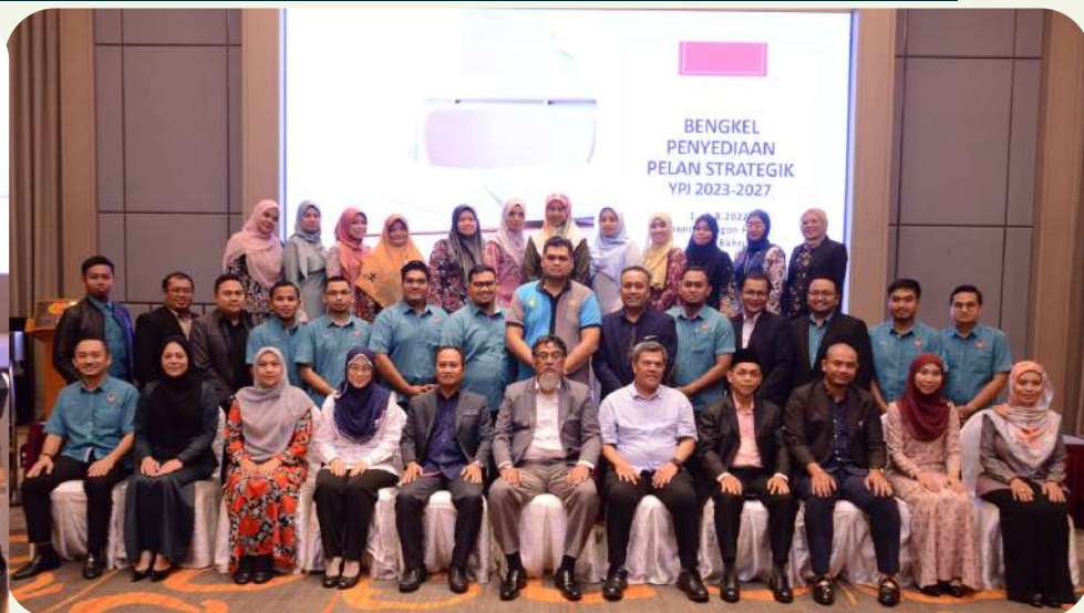
Bengkel Pelan Strategik 2023 - 2027 diadakan di Grand Double Tree Hotel, Johor Bahru pada 7-8 Ogos 2022